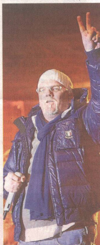
DJ Ötzi begeisterte in Gröbenzell 2000 Fans.

Die Leute von der JU haben das vor zwei Jahren mit meinem Management vereinbart. Und was ausgemacht ist, bleibt ausgemacht. Da