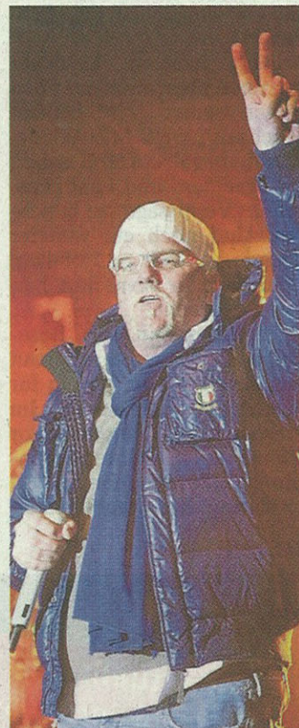
DJ Ötzi begeisterte in Gröbenzell 2000 Fans.

Die Leute von der JU haben das vor zwei Jahren mit meinem Management vereinbart. Und was ausgemacht ist, bleibt ausgemacht. Da